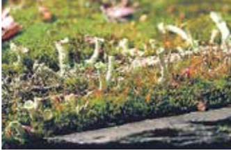
Flechten auf Schieferhalde