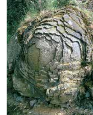
Steinerne Rose bei Saalburg

Das erwartet Sie im Naturpark Thüringer Schiefergebirge/Obere Saale