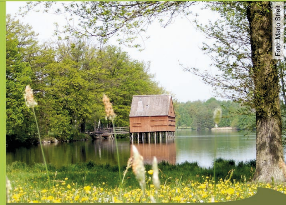
Blick auf das Pfahlhaus am Hausteich